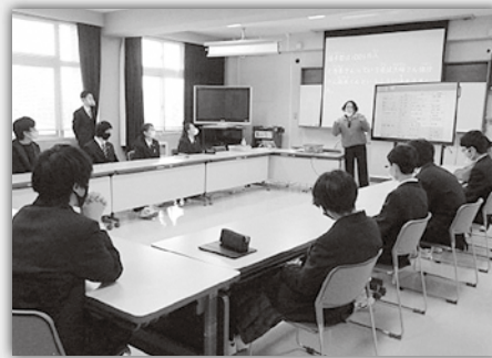
総合的な探究の時間