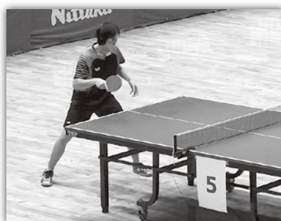
全国聾学校卓球大会