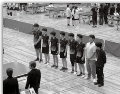
全国聾学校卓球大会